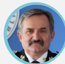
brig. gen. Václav Kučera ředitel Krajského ředitelství policie Středočeského kraje

„Toto ocenění nám otevřelo dveře k velmi vzácnému sdílení digitální praxe a zkušeností s byznysovou sférou.“